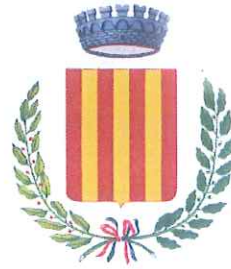
Comune di Cavour