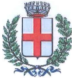
Comune di Barge