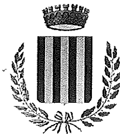
Comune di Cavour